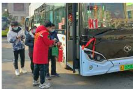
提供咨询服务;清理公交枢纽站环境卫生,让市民和游客的出行更加安全便捷,营造良好的春运出行环境。

本报讯 春节期间,公司组织“泰山百合”、泰安小美和党员志愿者开展“文明交通春运暖程”志愿服务活动,在火车站公交枢纽站、卜蜂莲花公交枢纽站、高铁公交枢纽站设立志愿服务点。志愿者们协助驾驶员做好乘客体温测量与健康码核对,对公交车厢进行消毒,督促驾驶员严格做好春运期间疫情防控,确保乘客乘车安全;引导来往乘客自觉排队乘车,为游客指引路线,让市民和游客的出行更加安全便捷,营造良好的春运出行环境。(张云 袁进)