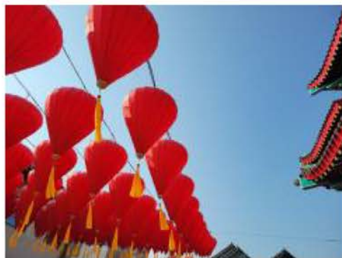
大红灯笼高高挂起

宽容有度,严肃执纪,这是我对《宽容》一书的一层理解。特别是在集体生活中,都有纪律规矩的约束,宽容一定要在严格执纪的基础上讲究有尺度的宽容,执纪下的宽容,是更大更有深度的宽容。唯有如此,我们才能从心所欲不逾矩。